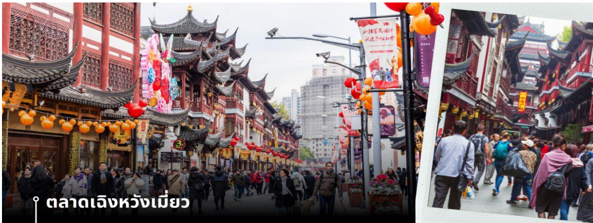
📍 ตลาดเจิ้งเหมียว

จากนั้นนำท่านสู่ ตลาดเจิ้งเหมียว เป็นศูนย์รวมสินค้า และอาหารพื้นเมืองที่แสดงถึงเอกลักษณ์ของชาวเซี่ยงไฮ้ซึ่งมีการผสมผสานระหว่างอดีตและปัจจุบันได้อย่างลงตัว ซึ่งเป็นย่านสินค้าราคาถูกที่มีชื่ออีกย่านหนึ่งของนครเซี่ยงไฮ้ให้ท่านอิสระช้อปปิ้งตามอัธยาศัย